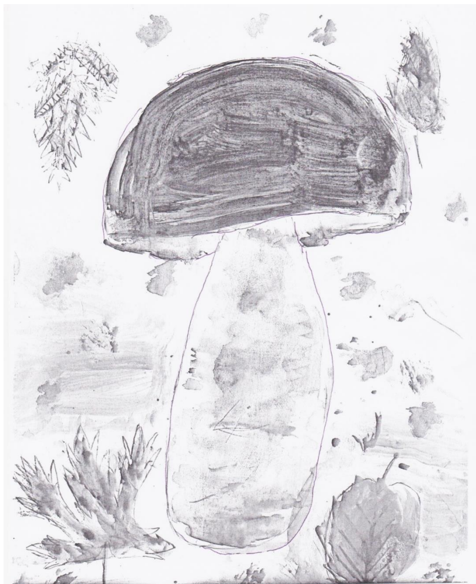
Obrázek Miroslava Krále.