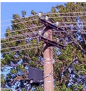
Typ 10: Reflektor, 1 ks