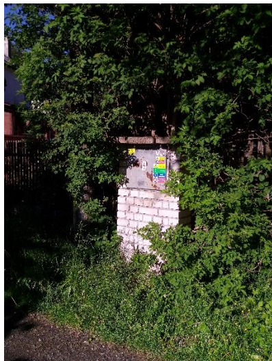
Obrázek 3: Celkový pohled

V areálu Amfiteátru se nachází 12 ks lamp, které jsou zapojeny do budovy.