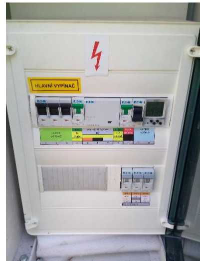
Obrázek: Celkový pohled, pohled na elektroměr, pohled do skříně