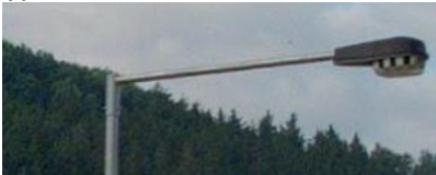
Typ 4: MC2 Zebra, 10 ks