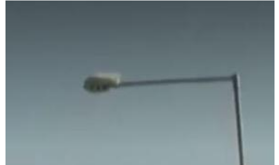
Typ 3: Hornet 2 ks