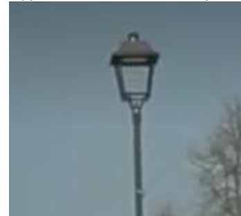
Typ 6: Historické lucerny, 15 ks