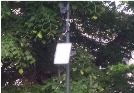
Typ 7: LED Reflektor, 4 ks