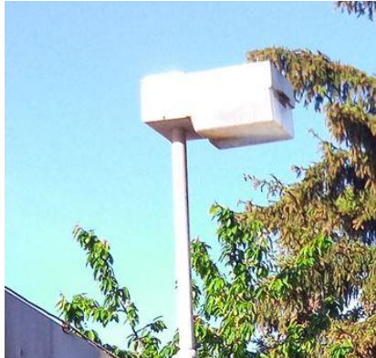
Typ 2: Elektrosvit, 1 ks