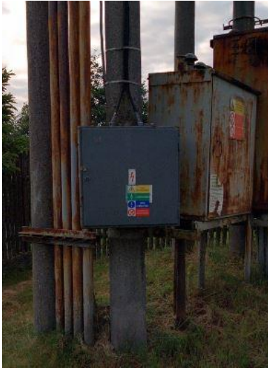
Obrázek: Celkový pohled