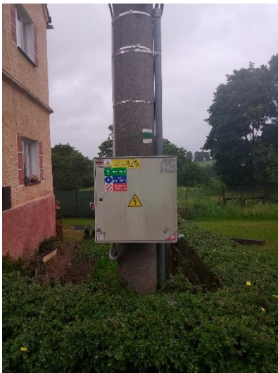
Obrázek 2: Celkový pohled