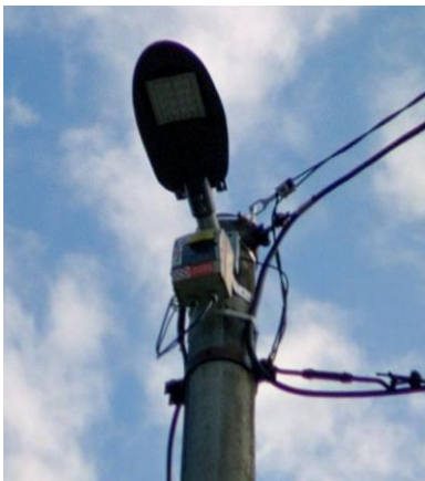
Obrázek: Celkový pohled