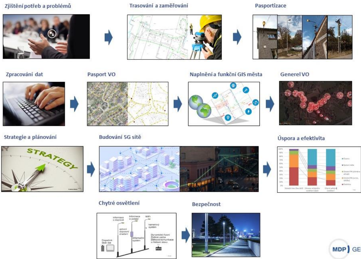
Obrázek 4: Postup zavedení Smart City do veřejného osvětlení