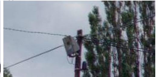
Typ 9: MACH1 HQ, 7 ks