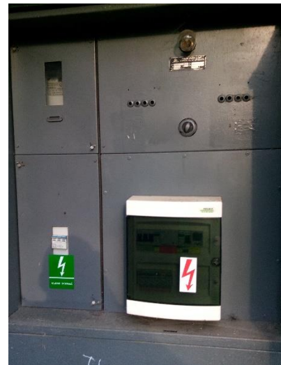
Obrázek: Celkový pohled, pohled na elektroměr, pohled do skříně