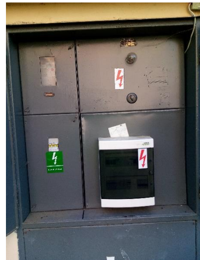
Obrázek: Celkový pohled, pohled na elektroměr, pohled do skříně