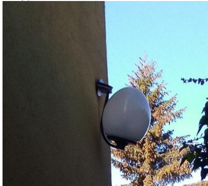
Typ 5: Kulaté svítidlo, 2 ks