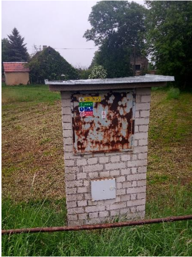
Obrázek 1: Celkový pohled