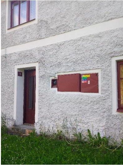
Obrázek: Celkový pohled