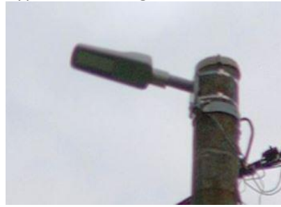
Typ 8: LED Malaga, 1 ks