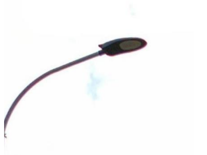
Typ 11: Guida, 314 ks