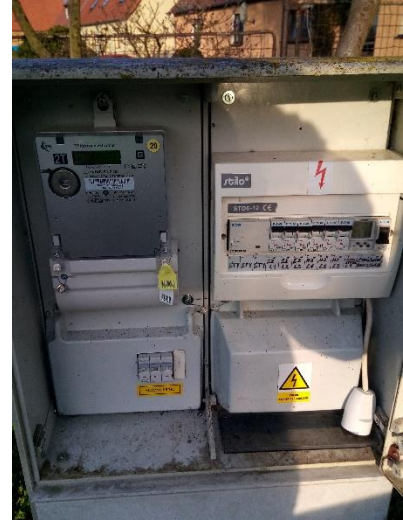
Obrázek: Celkový pohled, pohled na elektroměr, pohled do skříně