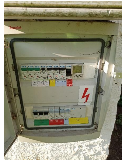
Obrázek: Celkový pohled, pohled na elektroměr, pohled do skříně