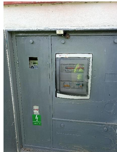
Obrázek: Celkový pohled, pohled na elektroměr, pohled do skříně