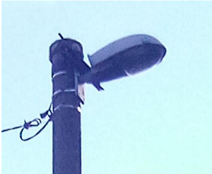
Typ 1 – Malaga, 78 ks