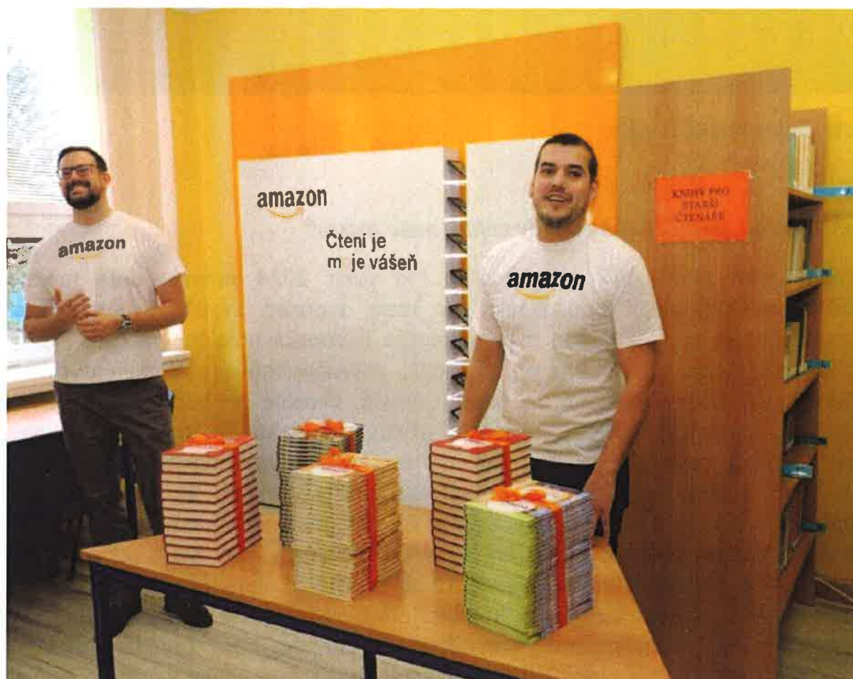
Foto z předávání daru firmy Amazon