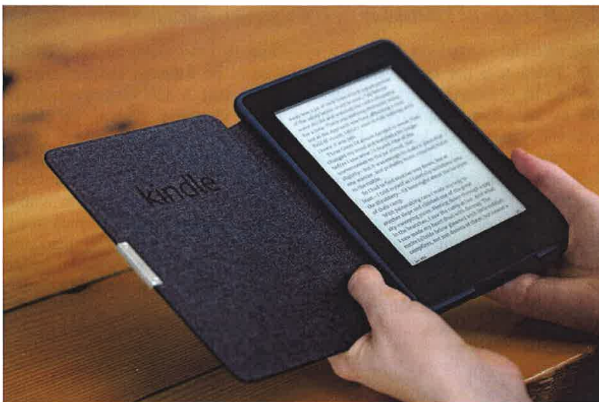
Foto elektronické čtečky.