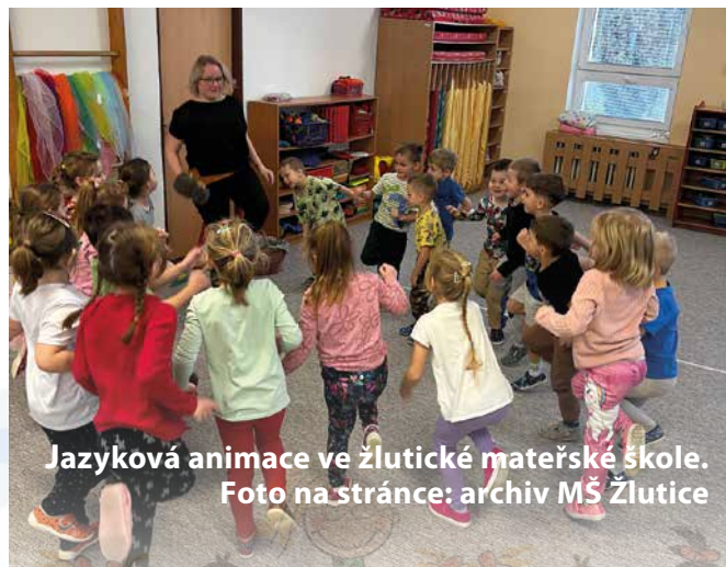
Jazyková animace ve žlutické mateřské škole.