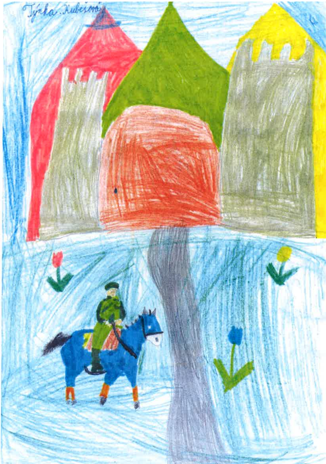
Obrázek Týny Kubešové, 2. třída ZŠ.