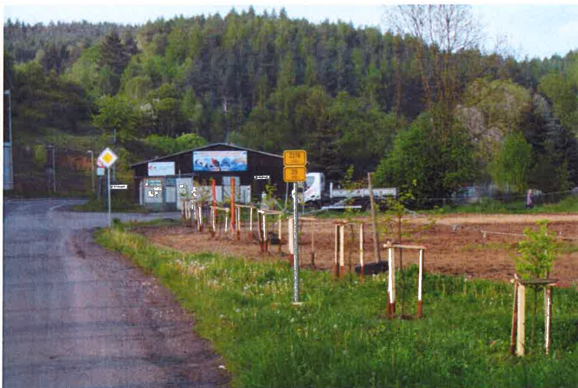
Babyky v Mlýnské ulici