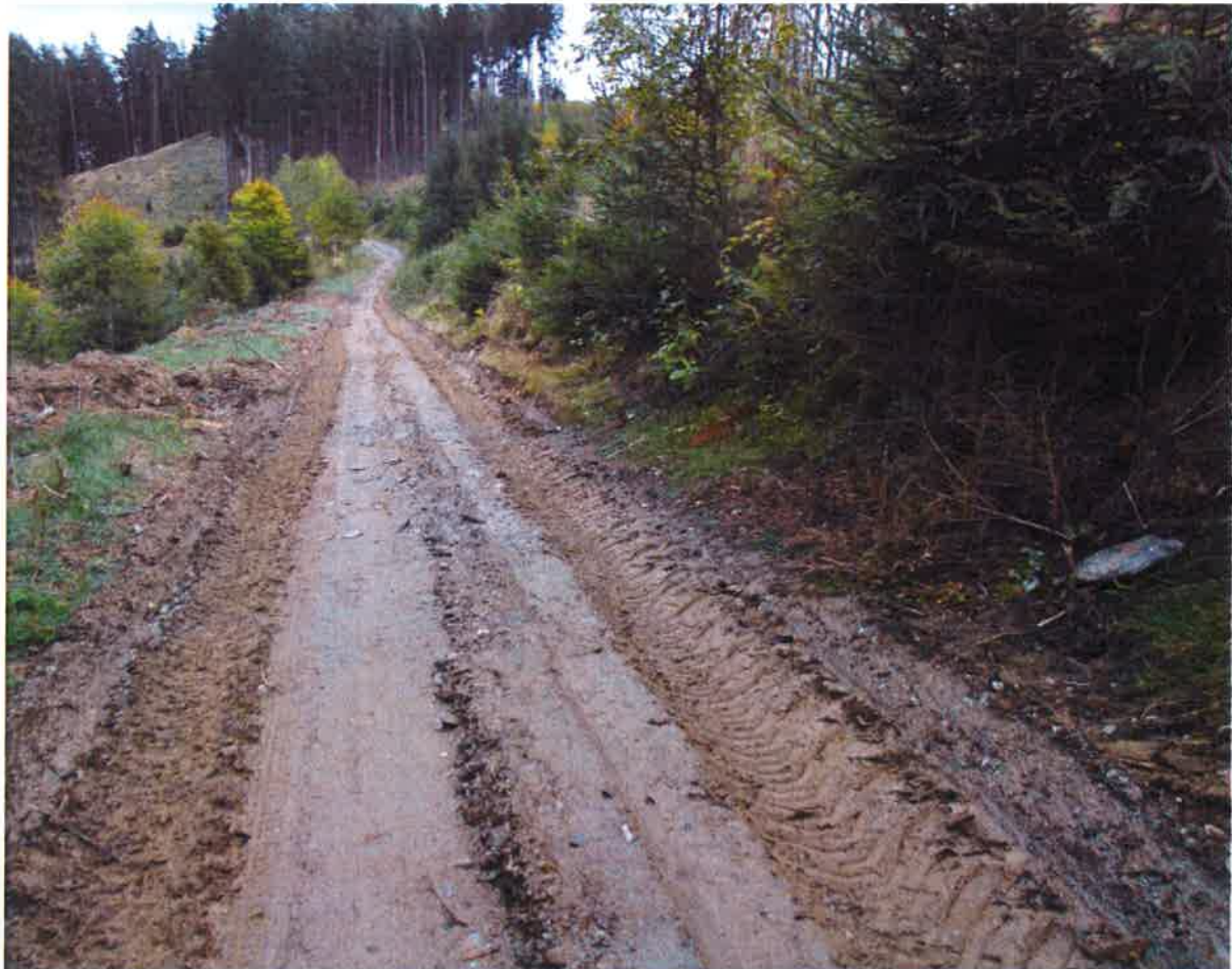
Cesta od Dolánky k Mostci před opravou

Za podpory z evropských fondů jsme již přebudovali nesjízdnou lesní zemní cestu od Dolánky k Mostci na celoročně sjízdnou komunikaci, která byla v loňském roce prodloužena až do Mostce. Vzhledem k tomu, že je po této cestě vedena i cyklotrasa, dostala i důstojný charakter. Máme dále připraven projekt na další pokračování a propojení oblasti Mostce s Přestáním. Tento projekt čeká na přiznání dotace z evropských fondů.