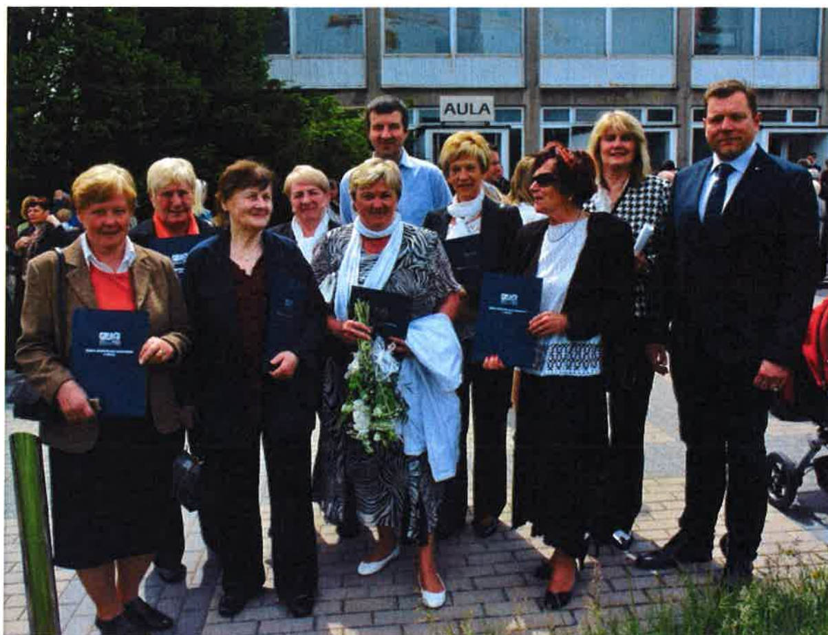
Starosta města a tajemník s absolventkami Virtuální univerzity 3. věku v Praze