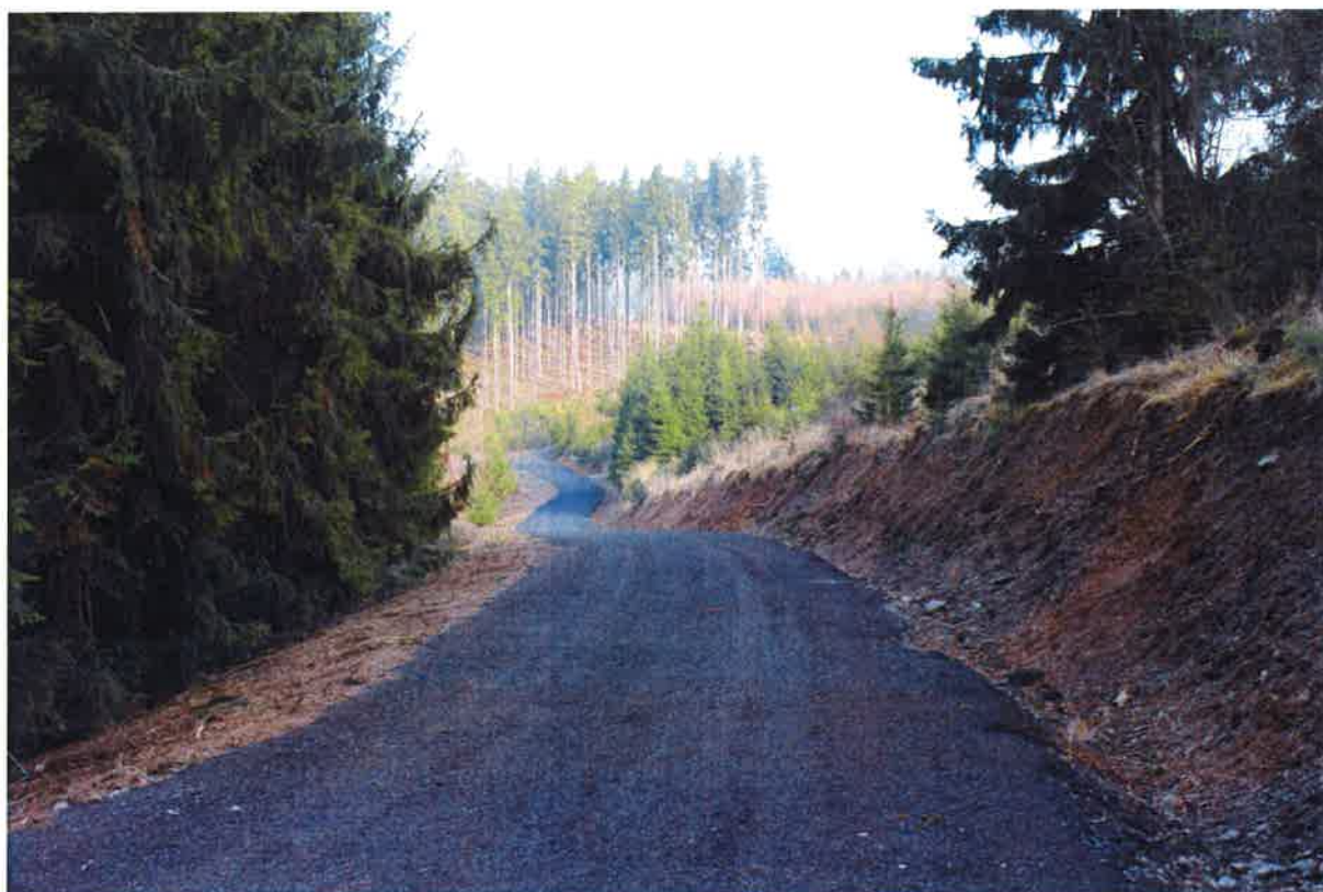
Cesta od Dolánky k Mostci po opravě.