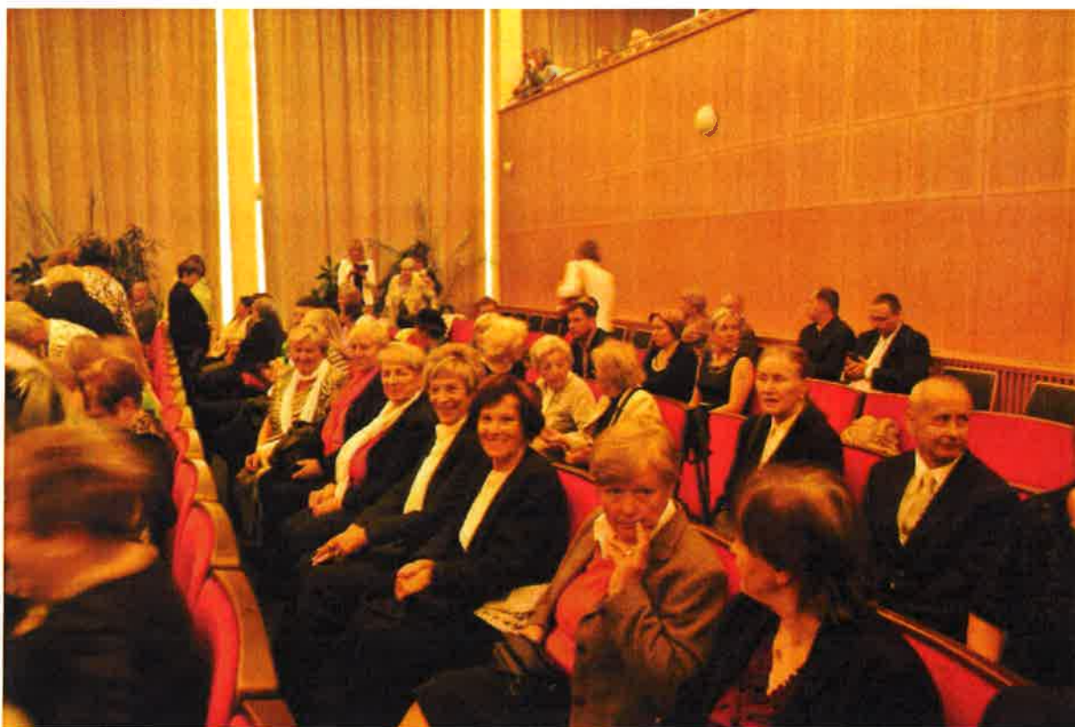
V aule České zemědělské univerzity v Praze