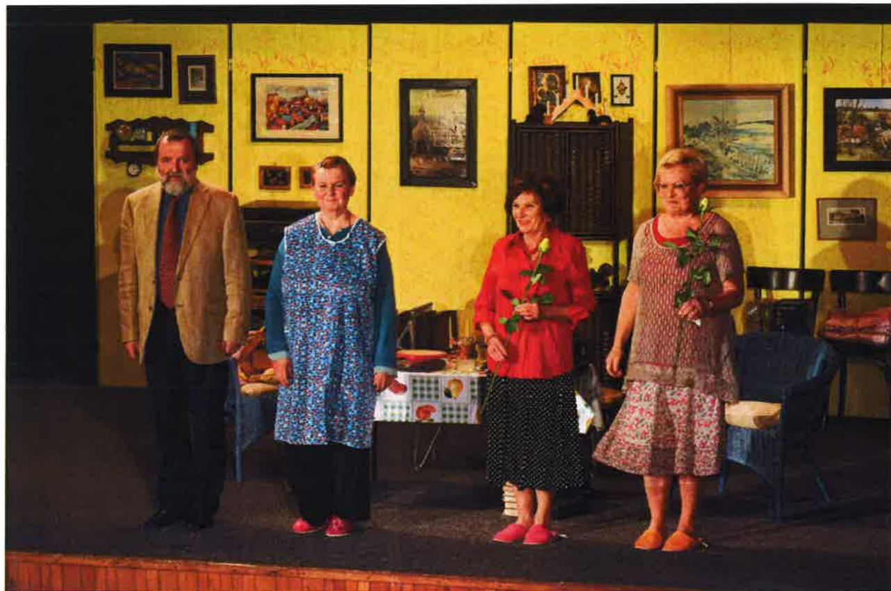
Fotografie ze žlutické inscenace.