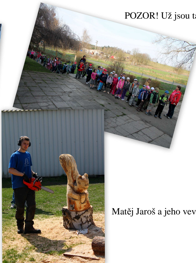
POZOR! Už jsou tady...