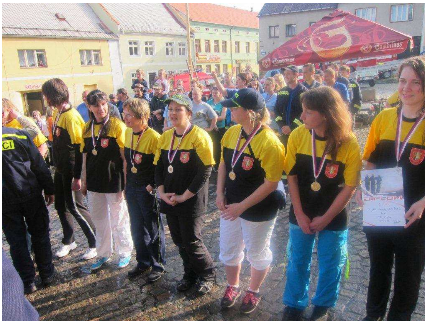
Vítězné družstvo žen.

Více v příštím čísle Žlutického zpravodaje.