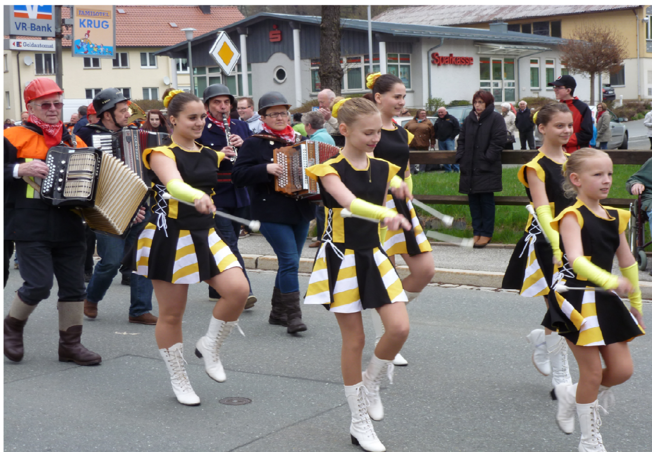
Naše mažoretky ve Warmensteinachu