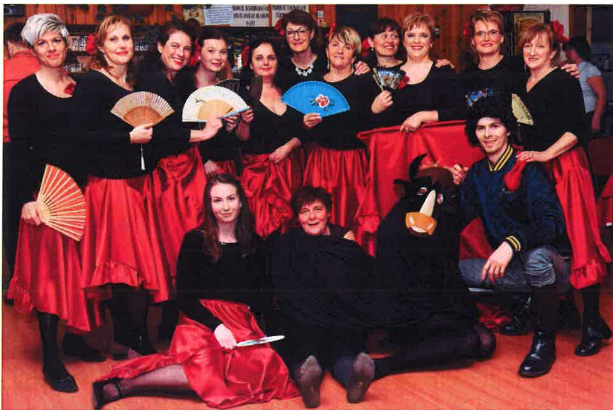
Společný snímek z plesového vystoupení klubových žen.