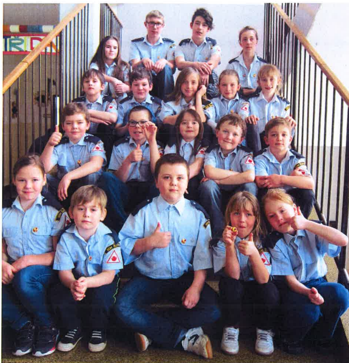
Snímek účastníků zkoušek z odbornosti.