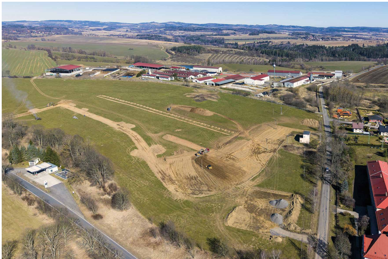
Pohled z výšky na pozemky pro výstavbu rodinných domů v lokalitě Žlutice SEVER, kde již začala skrývka ornice.

INFORMACE • ZAJÍMAVOSTI • KOMENTÁŘE • ROZHOVORY • KULTURA • SPOLKY