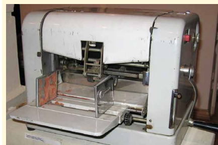
Cyklostyl československé výroby z roku 1980, značky Cyklos

Bezpochyby byly Žlutické zpravodaje svého času rozmnožovány také cyklostylem (správně mimeograf). Tento přístroj byl rozšířen v době, kdy moderní kopírovační stroje nebo osobní počítače nebyly dostupné (resp. neexistovaly). Požadovaný text se napsal na běžném psacím stroji na speciální blánu. Přitom se nepoužila páska s nanesenou barvou, takže písmeno psacího stroje prorazilo blánu a na ni nanesenou barvu přeneslo na pod ní ležící křídový papír, který se poté napjal na plechový buben cyklostylu. Barva nanesená na křídovém papíře se zvlhčila lihem a přenesla na čistý papír. Technika umožňovala jen omezený počet kopií, jejich kvalita postupně klesala.