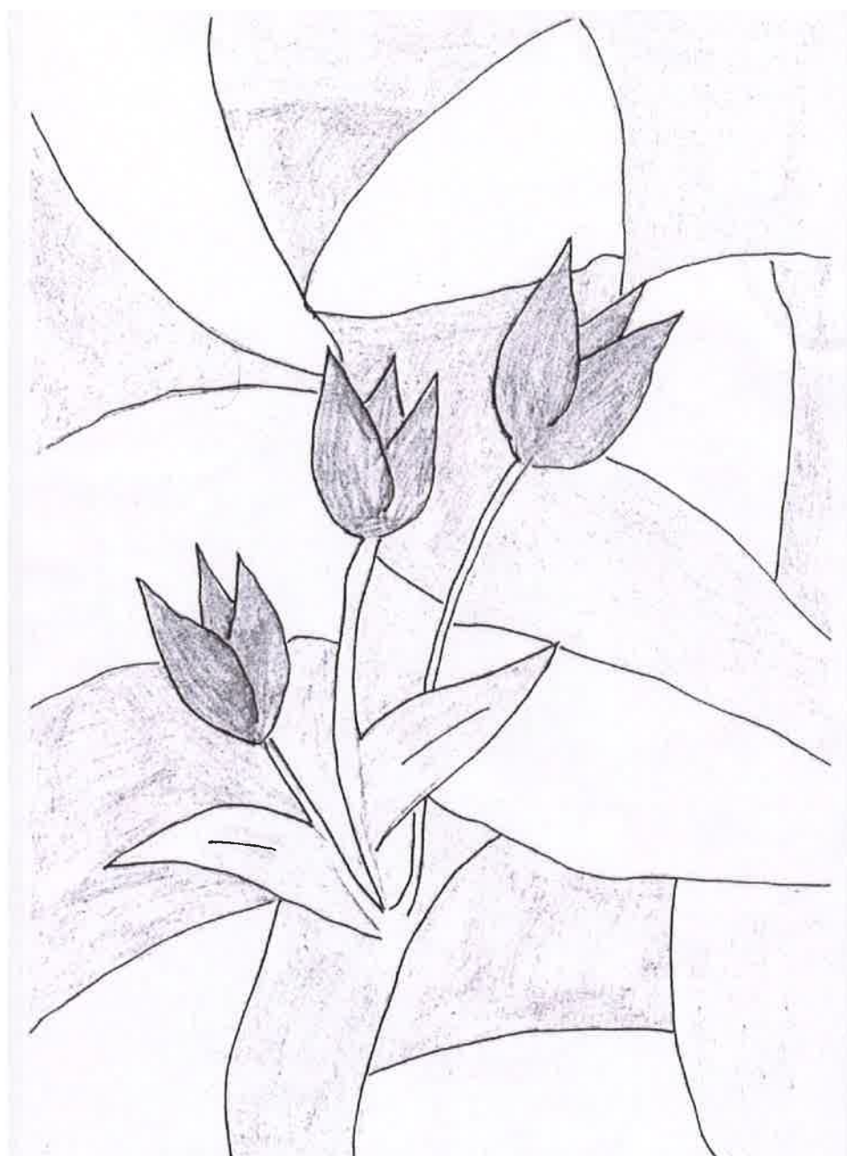
Obrázek Veroniky Škubalové