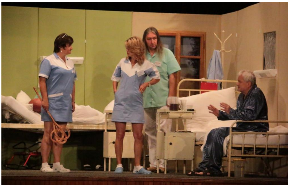
Foto z představení UROLOGIE.