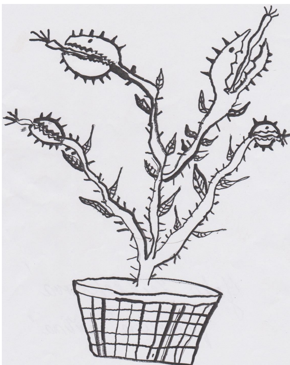
Kouzelná květina, obrázek Yoko Zeilhoferové.