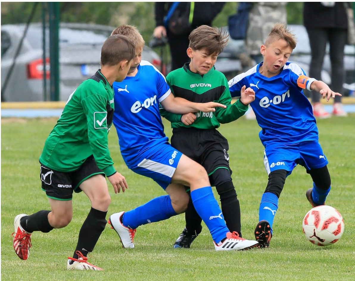
Fotografie z každoročního turnaje žáků ve fotbale.