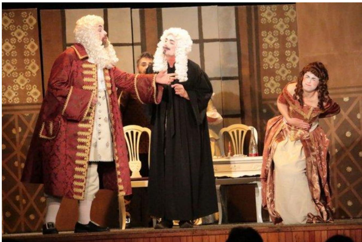
Foto z představení LÉKAŘEM PROTI SVÉ VŮLI.