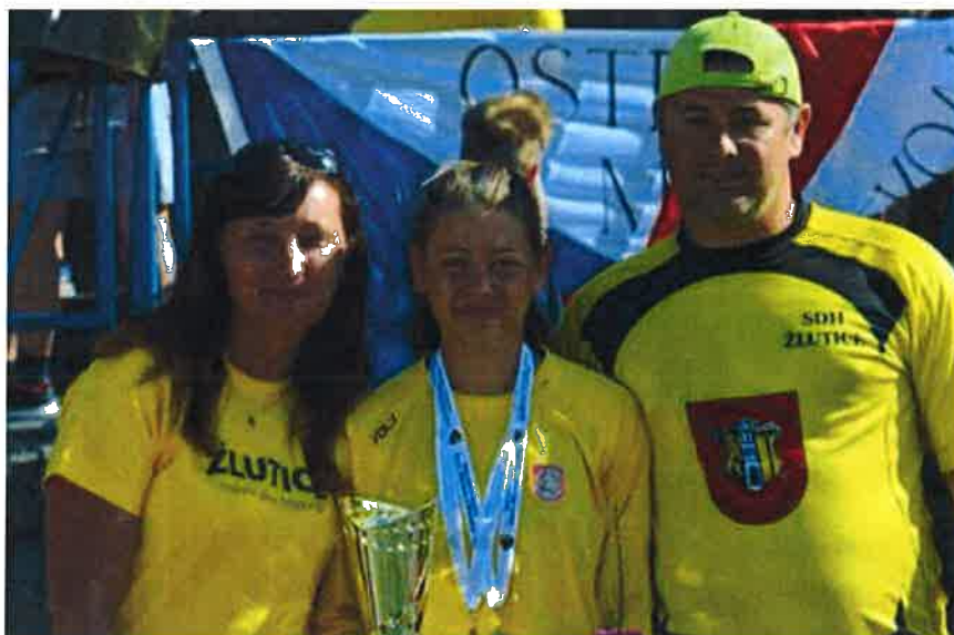
S rodiči po úspěšném finále ve Zlíně

Tento rok jsem se stala 2x vicemistryní ČR. A to v závodě na 60m s překážkami, který byl součástí hry Plamen. Finálový závod se konal ve Zlíně a probíhal úplně v pořádku. Hned v prvním pokusu jsem zaběhla čas 12:47 s, který stačil na 2. místo. Další závod ve, kterém jsem se stala vicemistryní ČR, byl výstup na cvičnou věž do 2. podlaží. Probíhal trochu jinak. Během sezony jsem