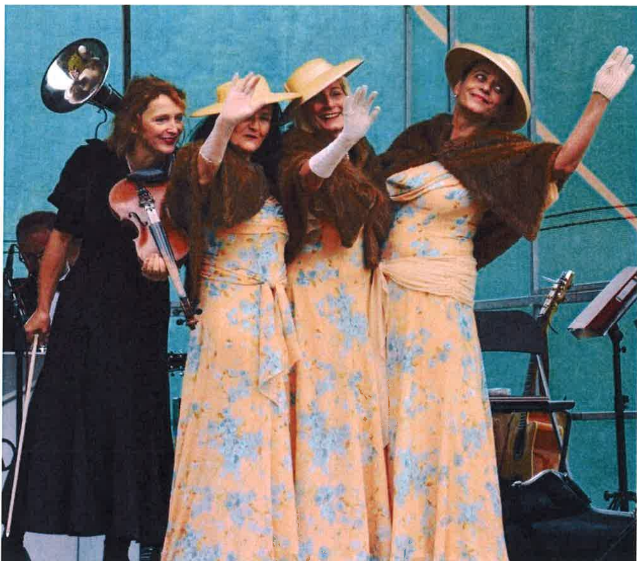
Snímek z vystoupení Sester Havelkových na setkání spolků ve Žluticích.