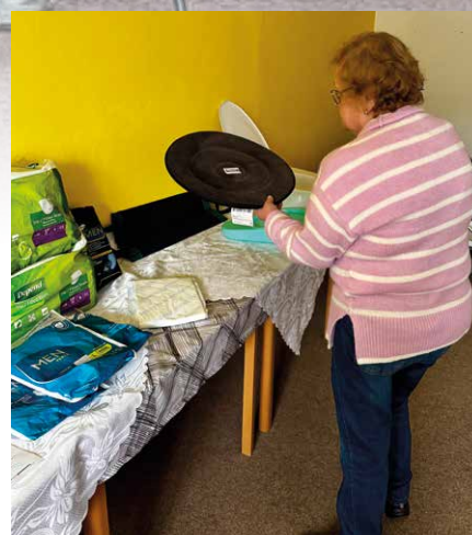
Jedna z návštěvnic Dne otevřených dveří Pečovatelské služby Žlutice

službu, která má pomoci rodinám, jež dlouhodobě pečují o své blízké. Díky této službě budou moci na určitou dobu svěřit svého rodinného příslušníka do péče odborného personálu a získat prostor pro odpočinek nebo vyřízení vlastních záležitostí.