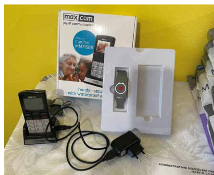
Tlačítko tísňové péče a pomoci