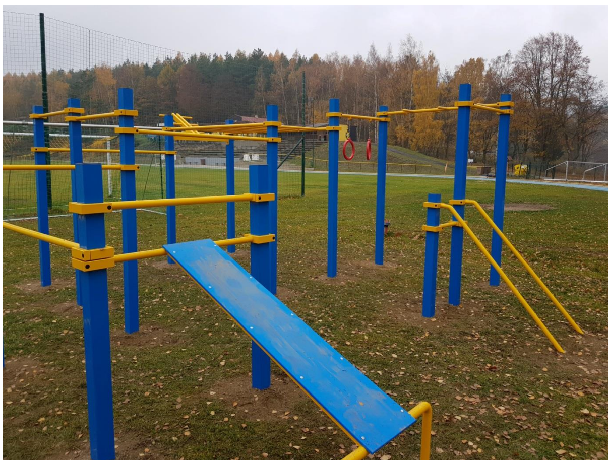
Foto: Workoutová sestava

Především na vysvětlenou: workout je sportovní aktivita s vlastní vahou těla, která zahrnuje různé cviky na veřejných sportovních hřištích, především na hrazdě, bradlech, žebřinách, horizontálních žebřících, kruzích a jiných konstrukcích. Hlavní důraz je kladen na cvičení s vlastní vahou, rozvoj síly a vytrvalosti (zdroj: Wikipedia). A právě za tímto účelem jsme postavili v areálu horního hřiště workoutovou sestavu. Byla postavena z vlastních prostředků (cca 240 tis. Kč), protože jsme bohužel nebyli úspěšní při získání dotace. Sestava jistě dobře poslouží starším žákům ZŠ při tělocviku a hlavně všem zájemcům o posilování vlastní vahou svého těla. Sportoviště má svá pravidla, které prosím v zájmu vlastní bezpečnosti respektujte.