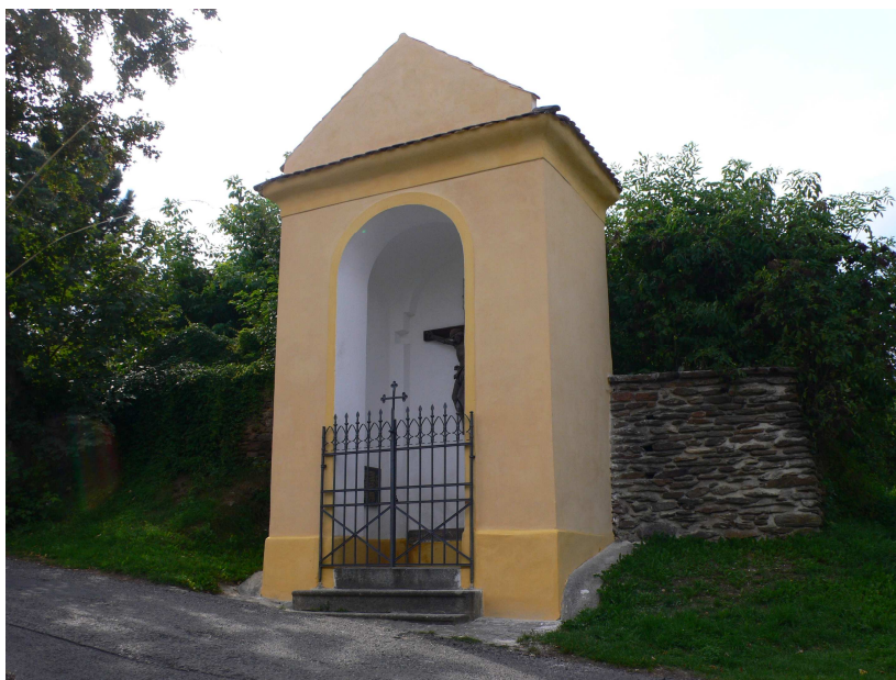
Opravená kaple sv. Kříže