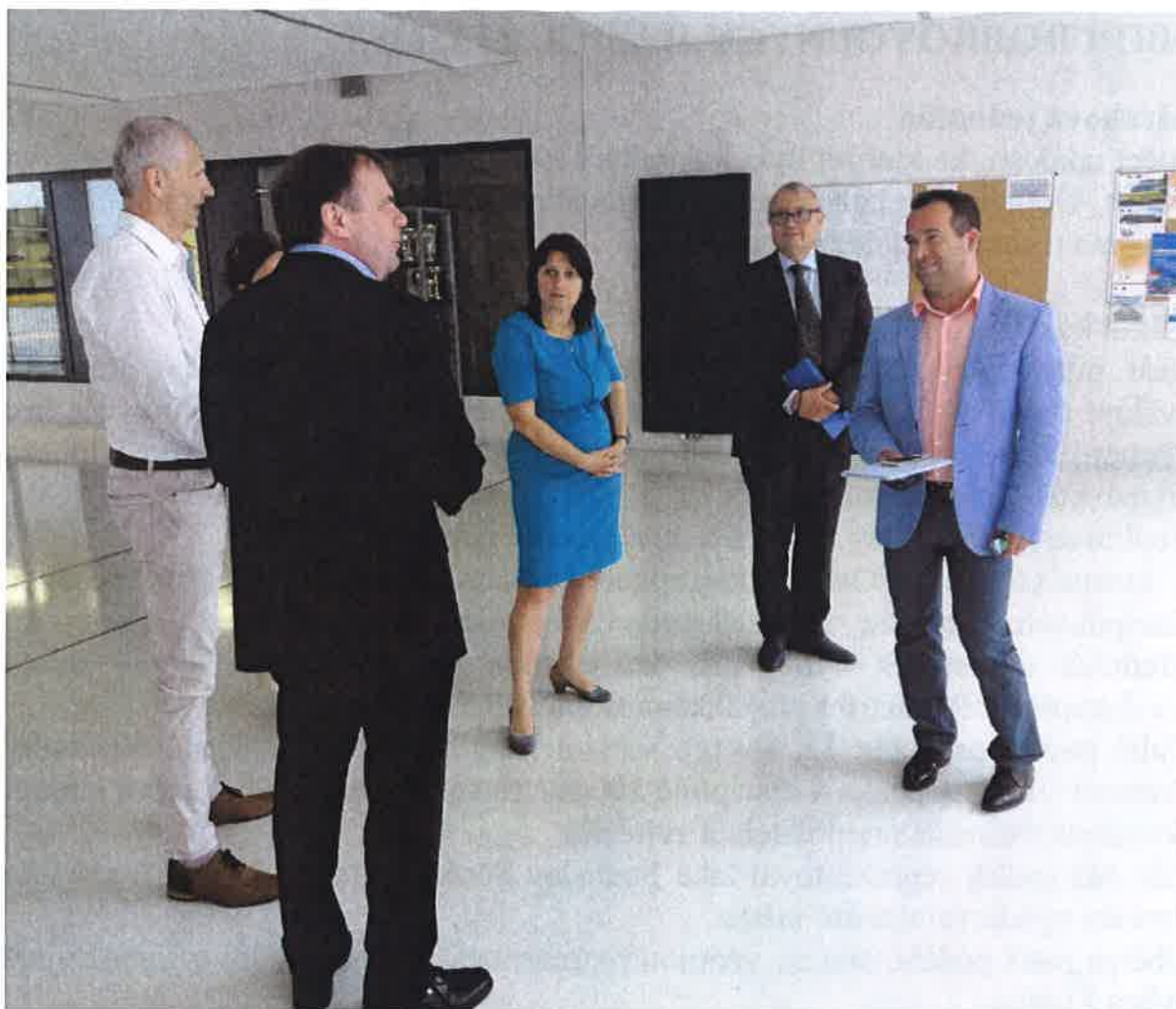
Fotografie z návštěvy Střední průmyslové školy v Ostrově