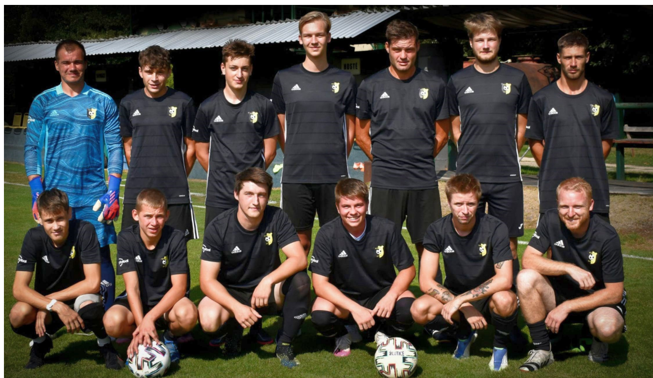
Na snímku žlutické A mužstvo 2022