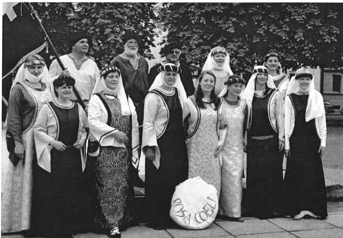
Nové středověké kostýmy souboru Rosa coeli.