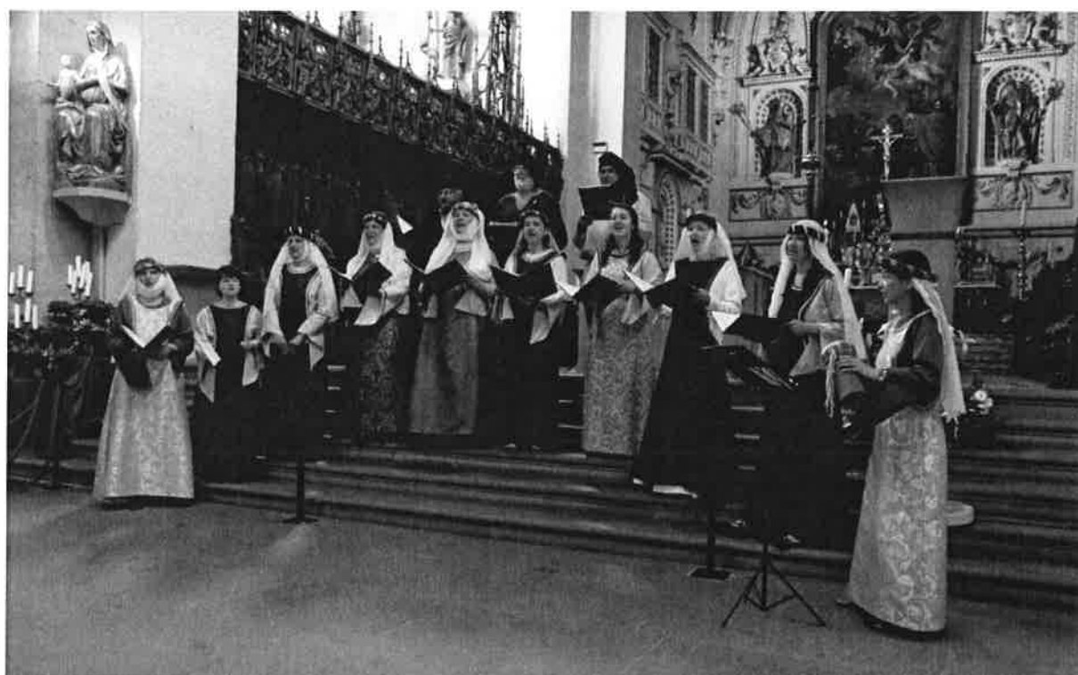
Koncert Rosa coeli v kostnické katedrále „Münster“.