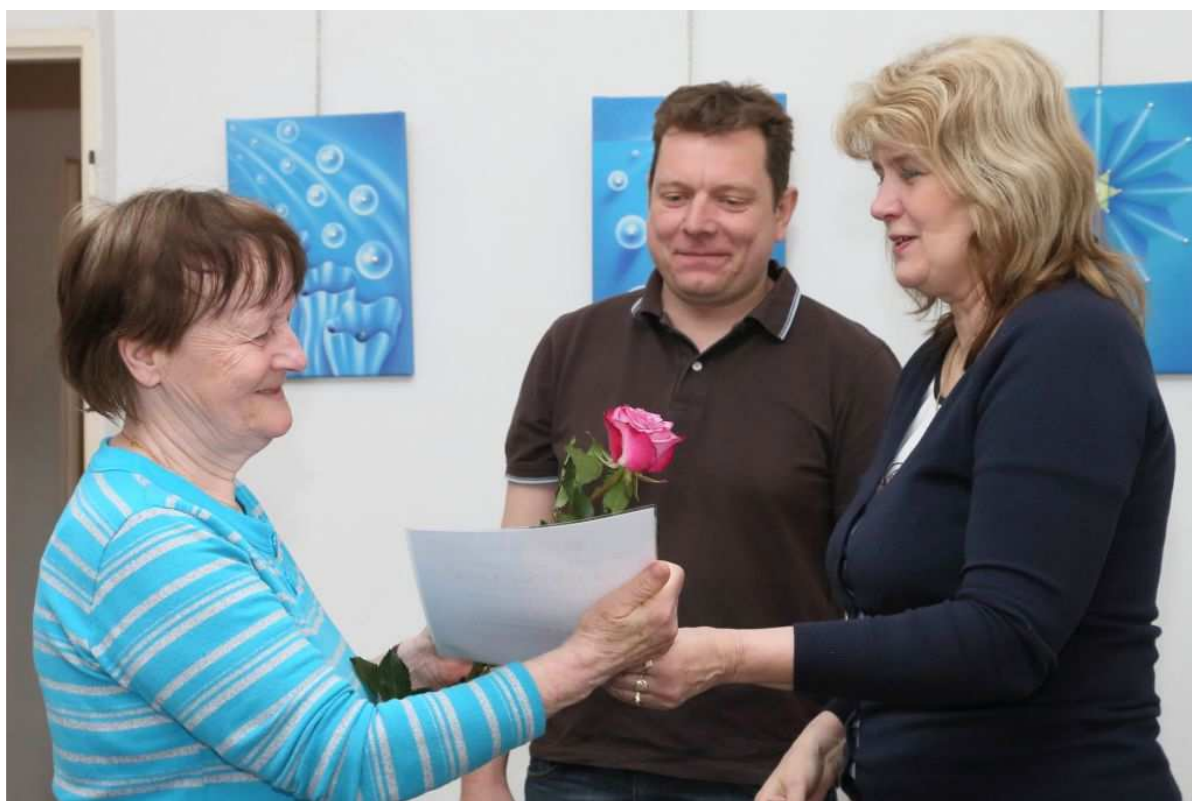
Slavnostní předávání pamětních listů VU3V