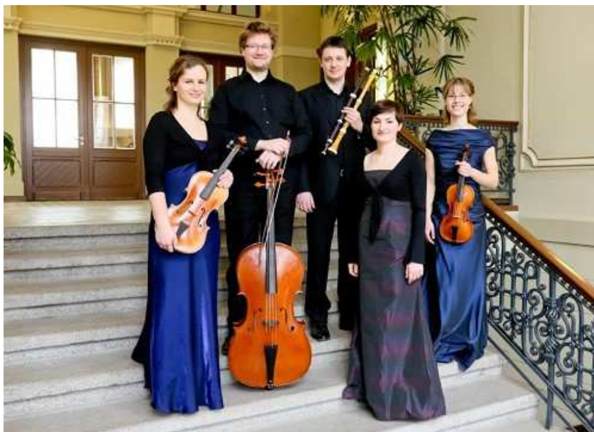
Camerata Bachiensis

Johann Gottlieb Janitsch Quadro g moll »O Haupt voll Blut und Wunden«