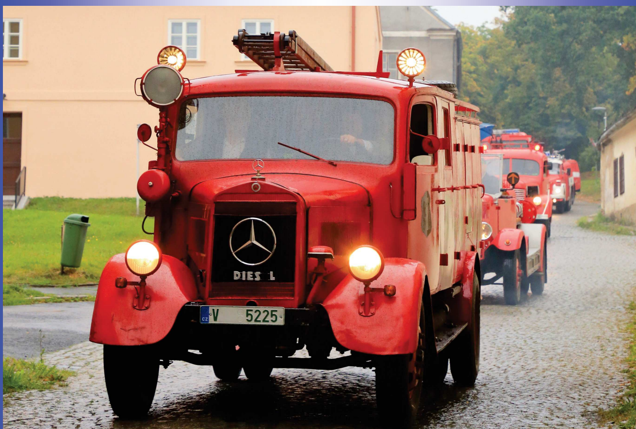
Příjezd historické hasičské techniky na Velké náměstí ve Žluticích