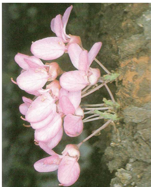
Vlevo zmarlika květ, vpravo zmarlika listy.