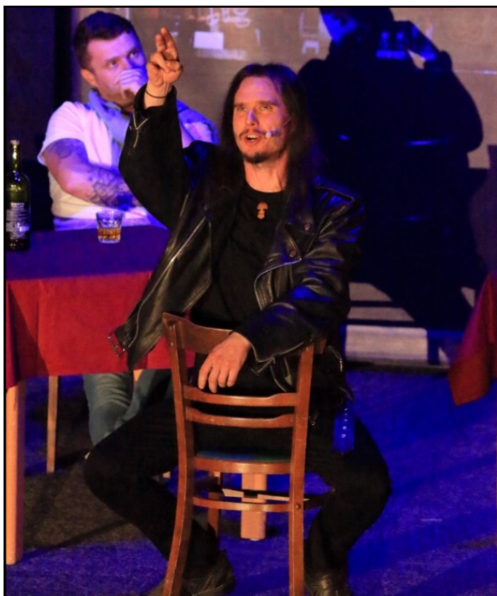
Muzikál „Zbývá příběh náš“.