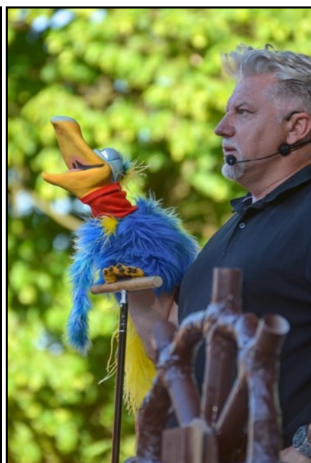
Dětský den