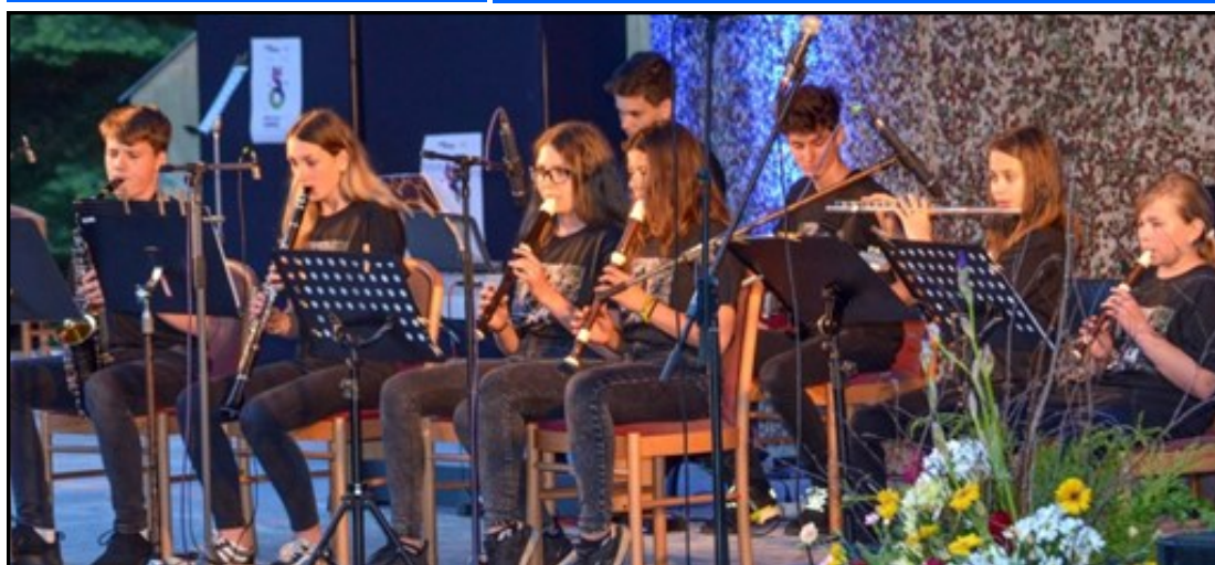
ZUŠ OPEN ŽLUTICE