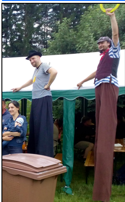
Žlutická pouť