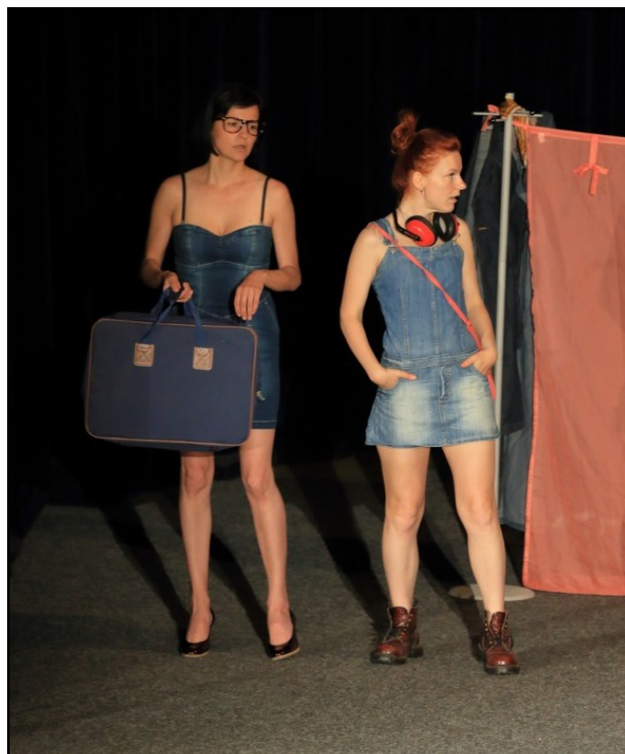
Představení „Zmrzlina“.