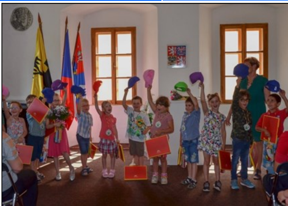
Slavnostní rozloučení s předškoláky - muzeum