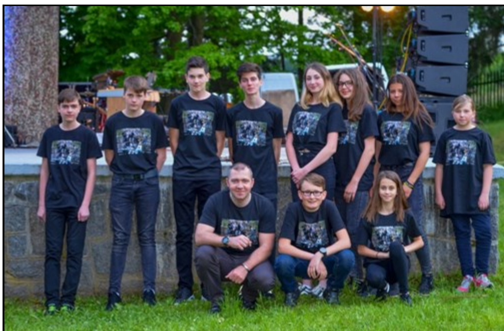
ZUŠ OPEN ŽLUTICE